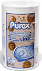
10563 Papier hygiénique en rouleaux géants à 2 épaisseurs PurexMD