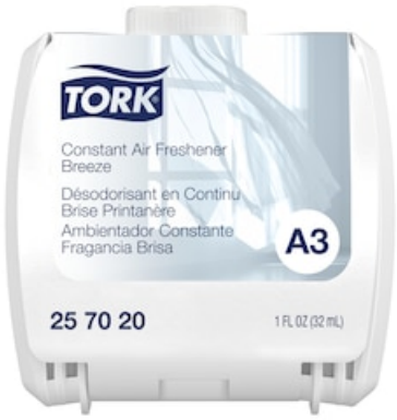
A3 REFILL BREEZE 6/1 CASE 257020