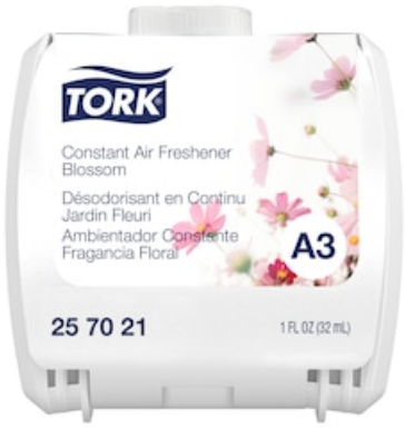
A3 REFILL BLOSSOM 6/1 CASE 257021