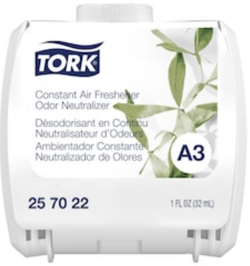
A3 REFILL OD NEUT 6/1 CASE 257022